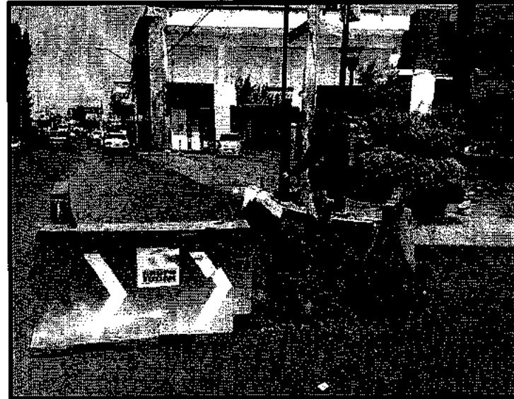
Cala de verificación sobre la calle La Turba, esq. Ernani, Col. Metropolitana.