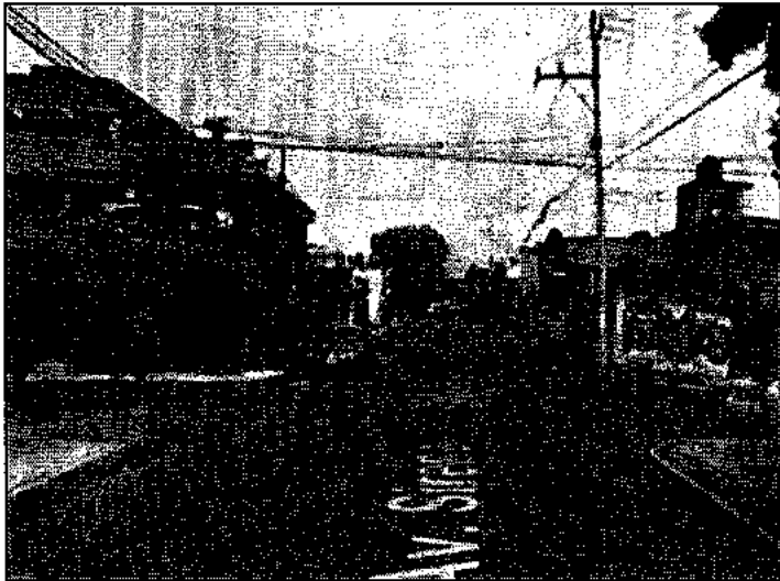
Antes del sismo.