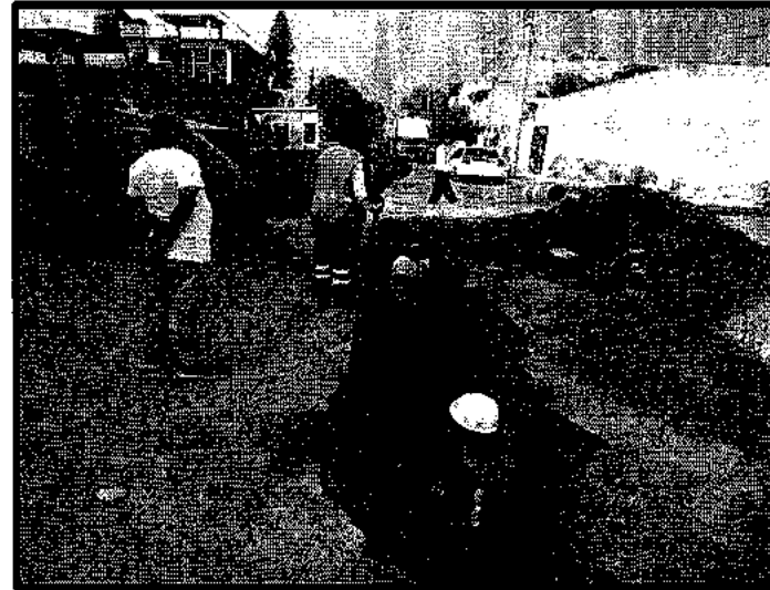
Instalación de tubería 0.30 m de Ø, sobre la calle Sábalo, entre Pez Vela y Océano, Col. del Mar.