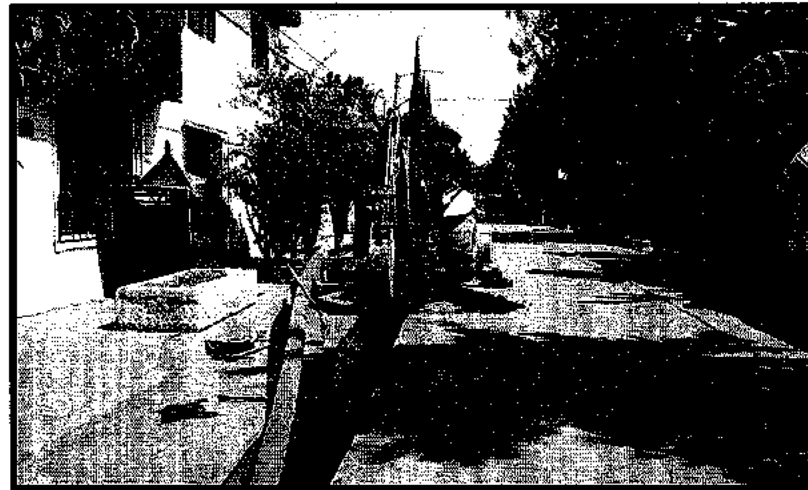
Instalación de tubería y calas de verificación sobre la calle Bodas de Fígaro, esq. Deodato, Col. del Mar.