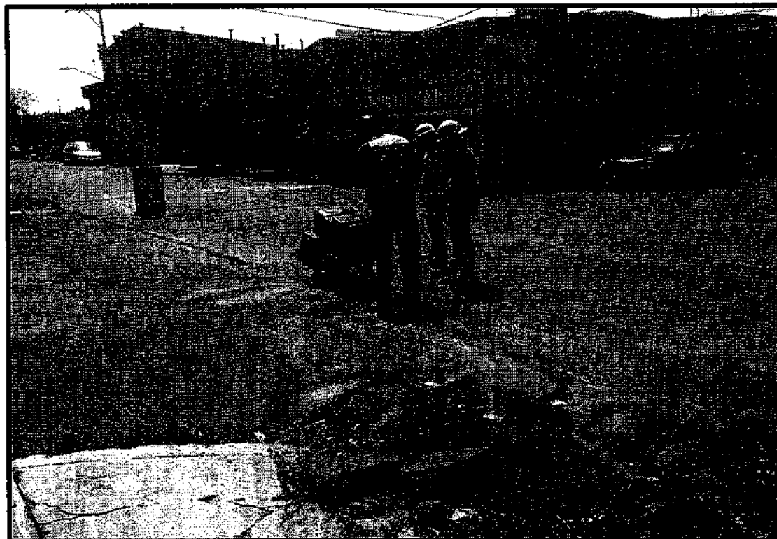
Corte de pavimento sobre la calle Laguna de Ensueño, entre Pirineo y Estanislao Ramírez Ruiz, Col. Selene.