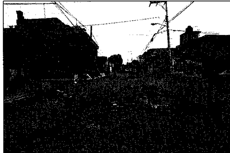
Después del sismo